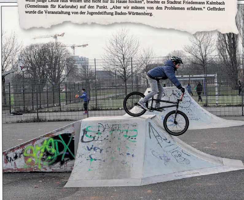
IN DEN KARLSRUHER SKATEPARKS, wie hier im Otto-Dullenkopf-Park, sind nicht nur die traditionellen Skateboardfahrer unterwegs, sondern auch Jugendliche auf BMX-Rädern.