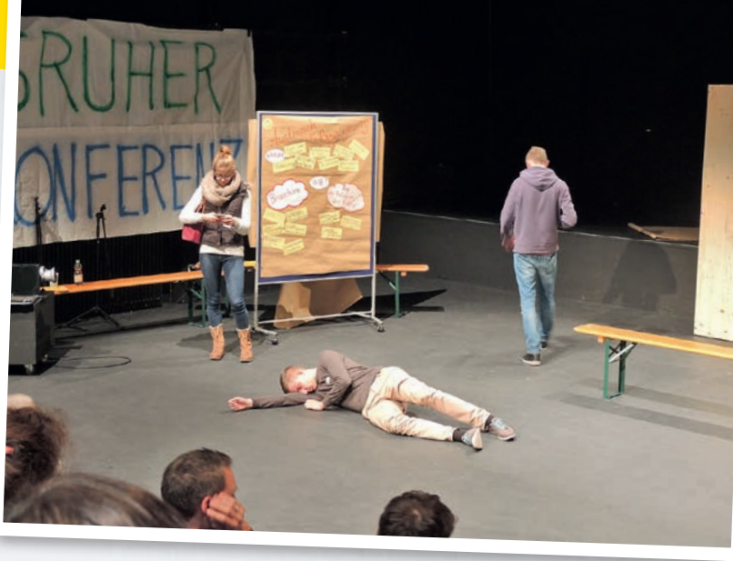
Zivilcourage ist gefordert bei Gewalt im öffentlichen Raum